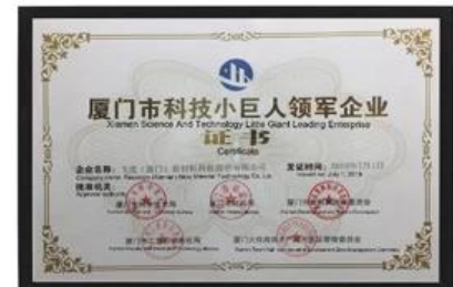
Xiamen Wissenschaft und Technologie Little Giant Leading Enterprise