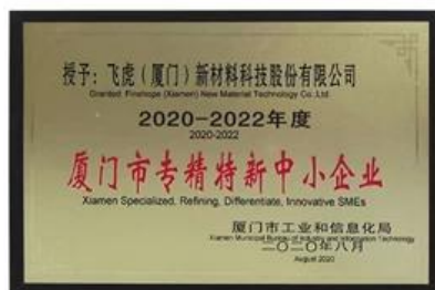
Xiamen Spezialisierte, verfeinernde, differenzierende, innovative KMU