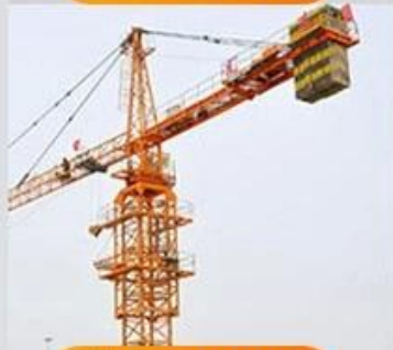
Tower crane construction equipment