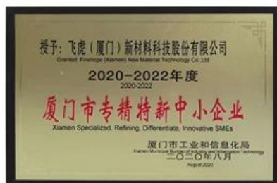
Xiamen: Spezialisierte, verfeinernde, differenzierende und innovative KMU