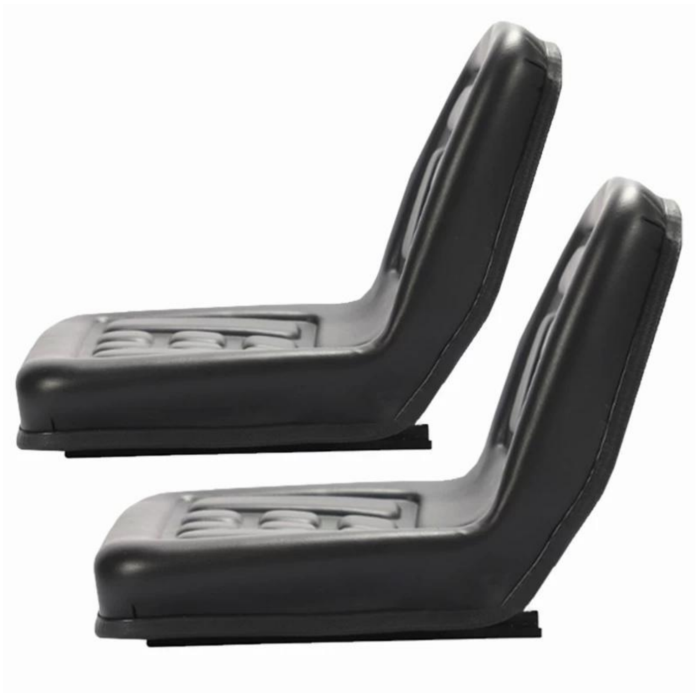
Passen Sie den wasserfesten Rasenmähersitz aus PU-Polyurethan an