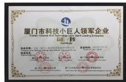
Xiamen Science and Technology Little Giant, führendes Unternehmen