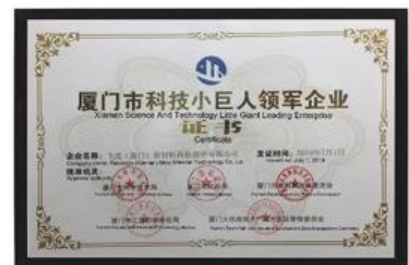
Xiamen Wissenschaft und Technologie Kleines riesiges führendes Unternehmen