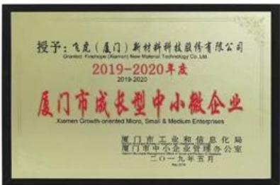
Microempresas, pequeñas y medianas empresas orientadas al crecimiento de Xiamen