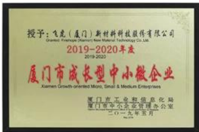
Xiamen Micro, petites et moyennes entreprises axées sur la croissance