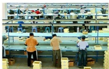
R & D Department