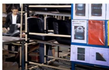
QC / Acceptance Standard