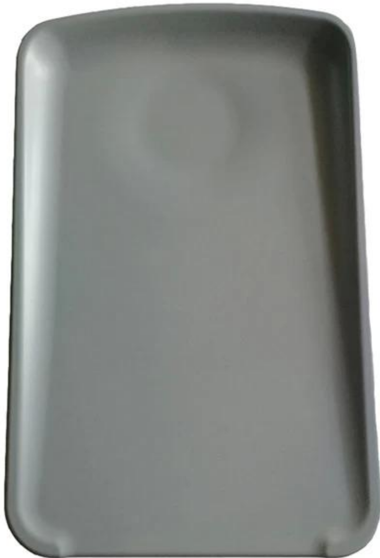
Usine personnaliser coussin à langer en mousse moulée pu pour bébé