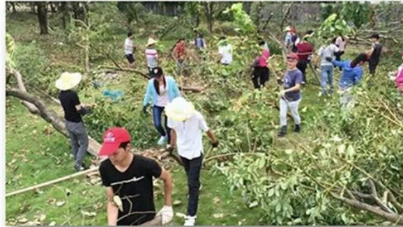
Voluntary tree planting after Super Typhoon Meranti in 2016