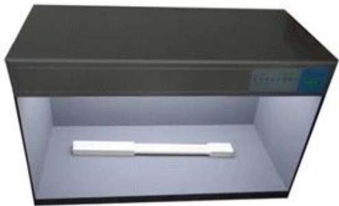
Standard Color compare Lighter box