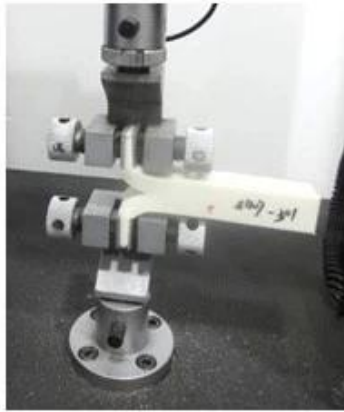
Tear Resistance Test