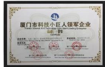
Micro, Pequenas e Médias Empresas Orientadas para o Crescimento de Xiamen