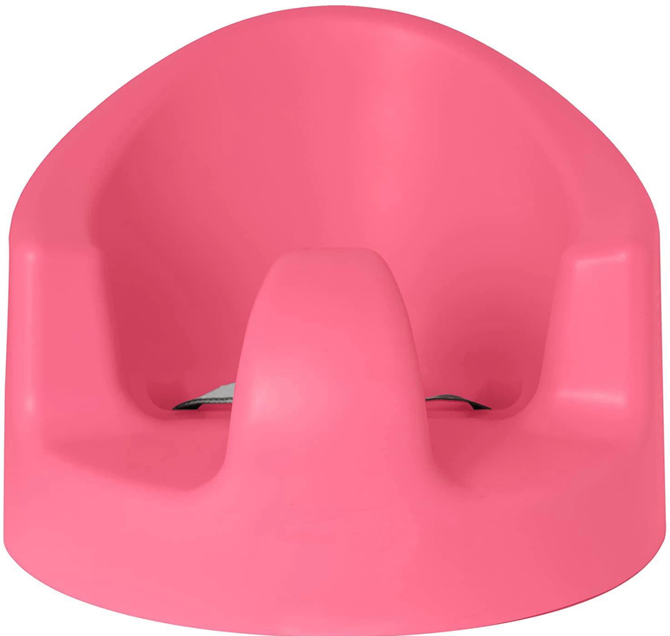
Cadeira de jantar para bebê com reforço de poliuretano Pu