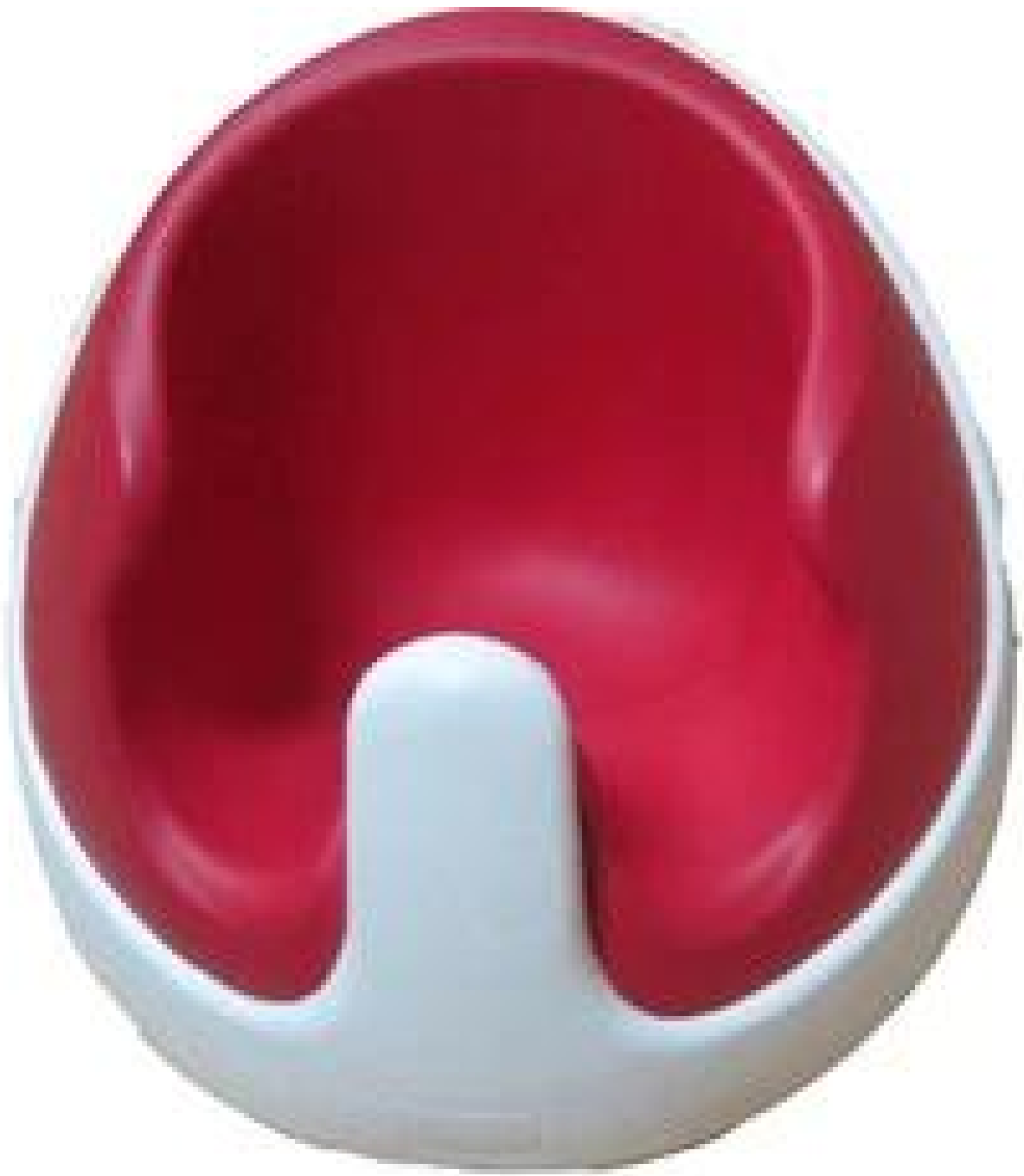
Novo produto do fabricante, cadeira elevatória portátil de poliuretano PU para bebês