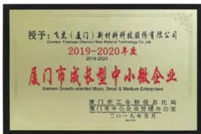
Micro, pequenas e médias empresas orientadas para o crescimento de Xiamen